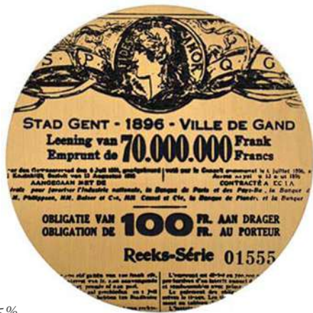
Lotenlening stad Gent 1896