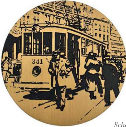
De Gentse Tram