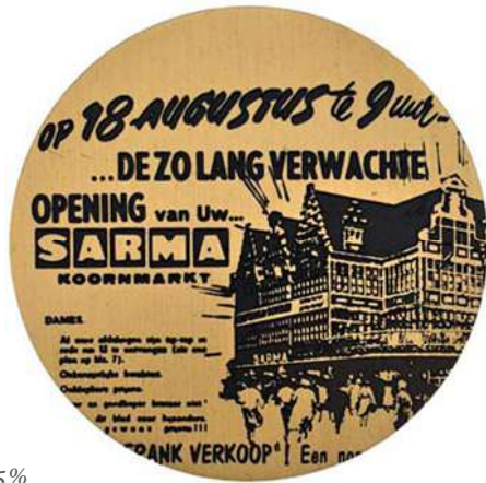
De opening van de Gentse Sarma