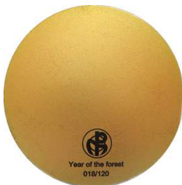
Keerzijde schaal 60%