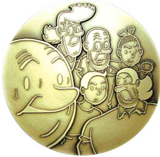
Wivine VERNIEUWE (°1951)

Kweeperstraat 71, 9032 Wondelgem @ wivinev@gmail.com © 09/230 94 60